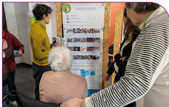
Co-construction du nouveau projet associatif (ALGED en mouvement)