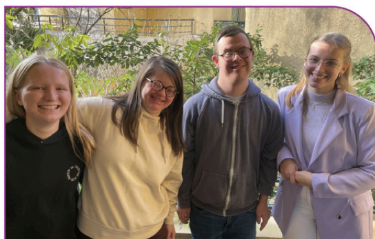
Ouverture d'habitats inclusifs