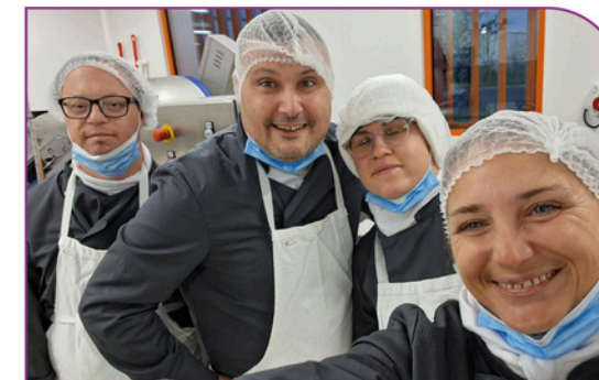
Ouverture d'un nouvel atelier hors-murs : légumerie avec la cuisine centrale de Caluire