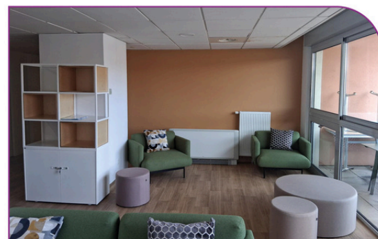
Ouverture du foyer de vie de l'espace attique (La Providence)