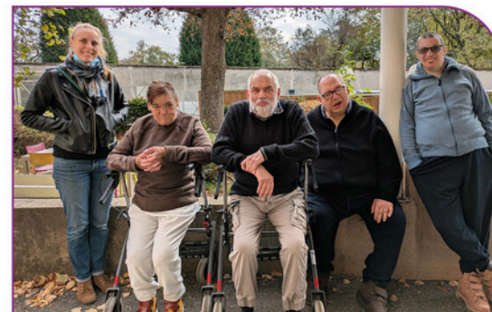
Création du comité «Ma vie, mes choix», pour travailler les sujets d'autodétermination