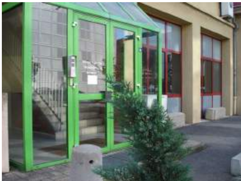
SAVS - Lyon 9 - Gorge du Loup