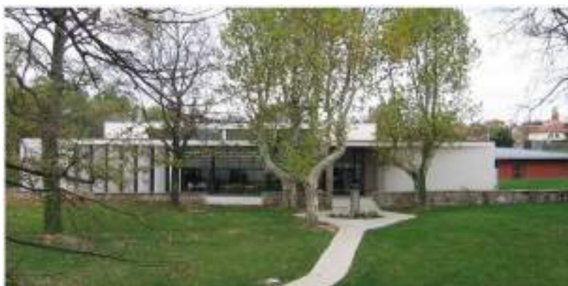
Le nouveau Tremplin