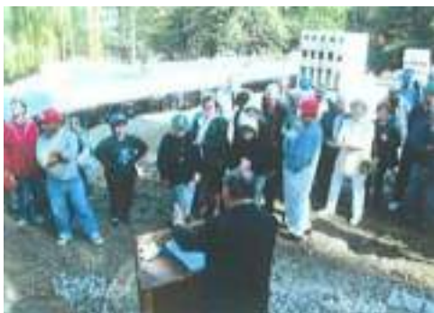
Discours devant les futurs résidents et leur famille

La première pierre a été posée le 11 octobre 2001 avec la médaille de l'ALGED.