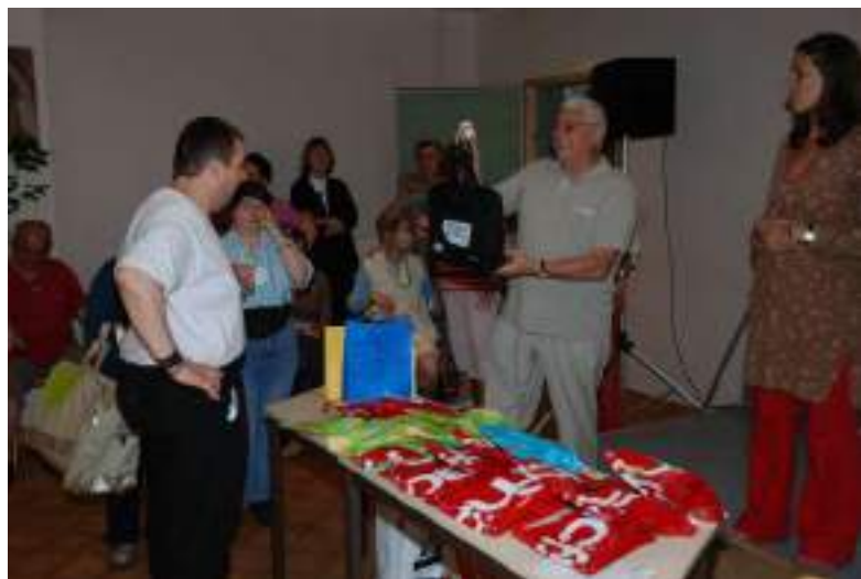
Distribution de cadeaux à Noël aux personnes accompagnées