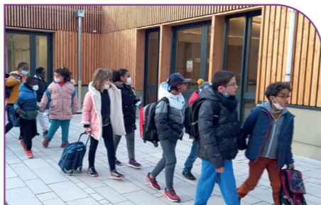
L'IME Marguerite Girier ouvre ses portes