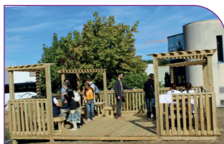
Aménagement de structures en bois à l'ESAT Didier Baron