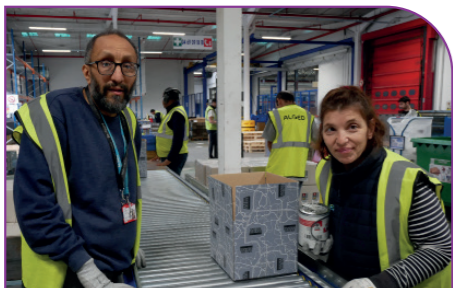
Lancement de l'atelier hors-les-murs chez Renault Trucks